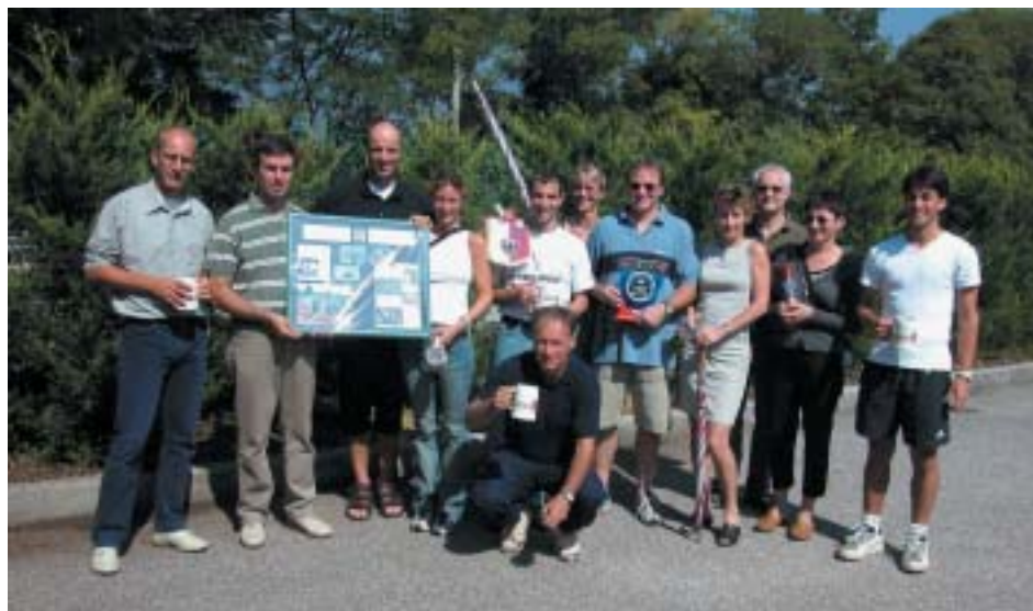
Gli atleti del Tc C10 e del Tc Forchheim, posano per la foto ricordo.

ne dell'Annafest, i 10 anni del gemellaggio.