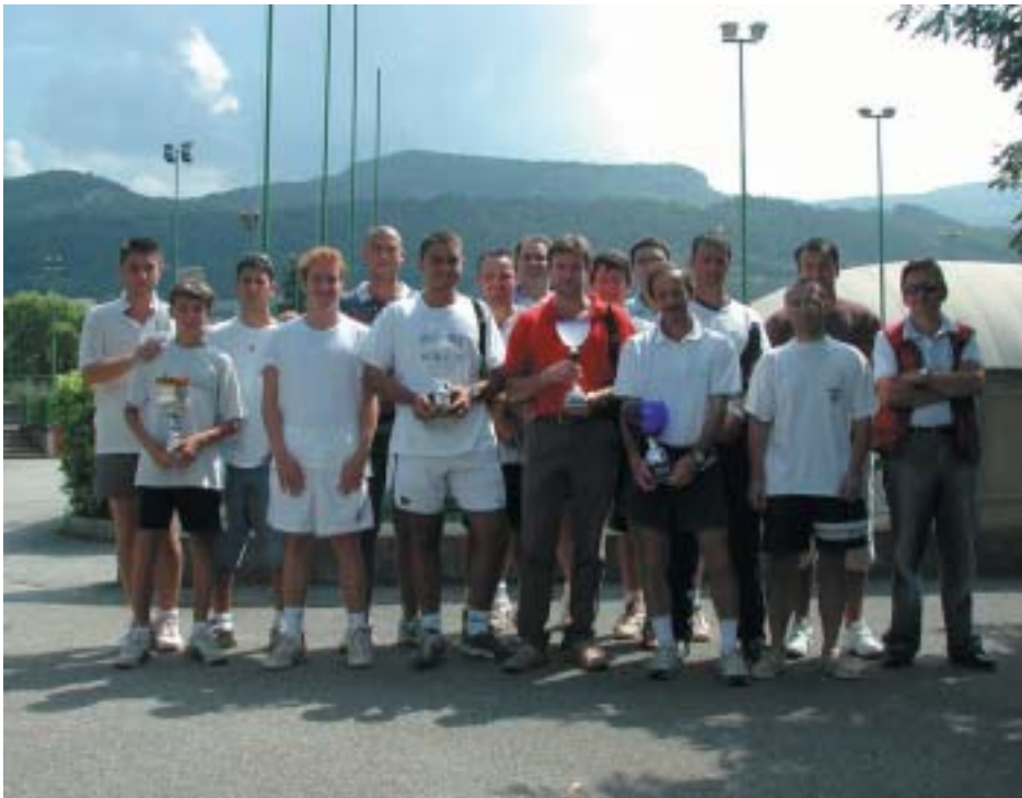
I partecipanti all'edizione 2002 della C10 Cup

Ancora un successo del Tc C10 nel Quadrangolare a squadre di agosto