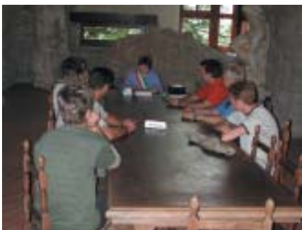
Il ricevimento in municipio