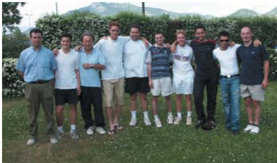
La formazione di Serie C al gran completo dopo la vittoriosa trasferta di Trento contro l'Ata Battisti.