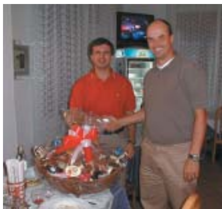
Scambio di doni tra i rappresentanti dei due club.

Prosegue con grande entusiasmo il gemellaggio che da più di 10 anni lega il Tennis Club C10 e il Tennis Club Forchheim, cittadina tedesca della Baviera che intrattiene stretti legami di amicizia con Rovereto. Dal 13 al 15 settembre i tennisti tedeschi sono stati ospiti del Tennis Club C10 che ha voluto ricambiare con questa occasione d'incontro, l'invito degli amici di Forchheim nel luglio del 2000, per festeggiare, in occasio-